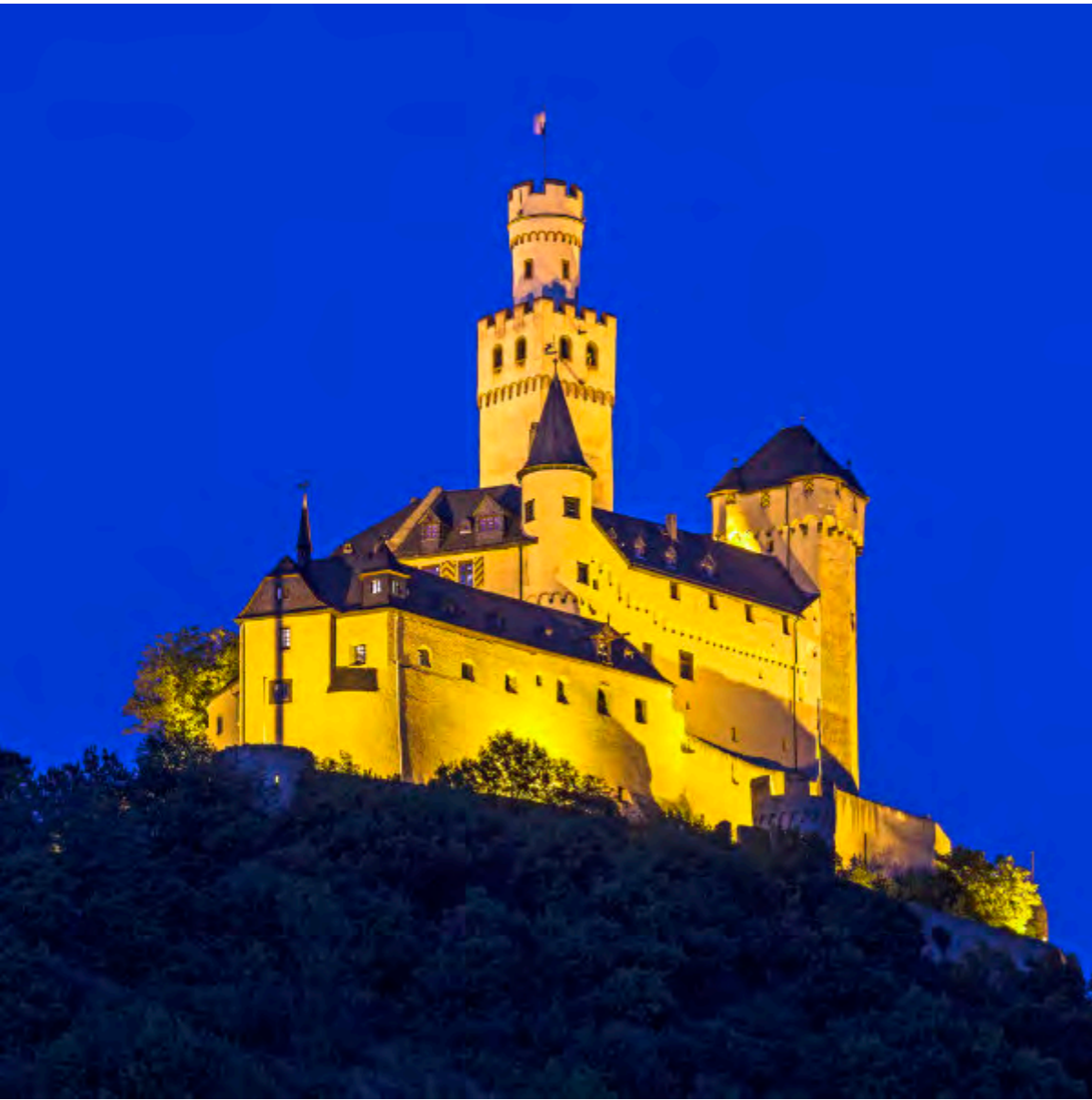
Wenn die Nacht kommt, leuchtet die Marksburg – und lässt keine Frage offen, wer hier das Tal regiert.