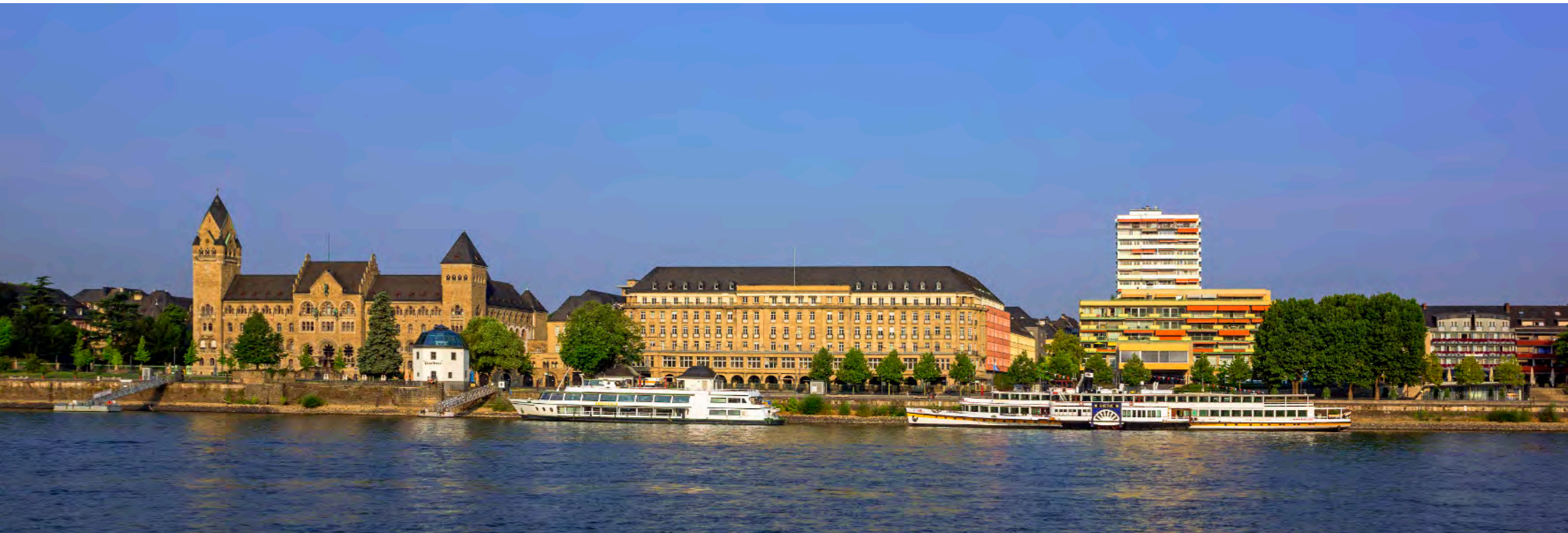
Das Koblenzer Rheinufer mit dem Preußischen Regierungsgebäude (1902–1906) und dem Schaufelraddampfer »Goethe« der Köln-Düsseldorfer am Anleger.