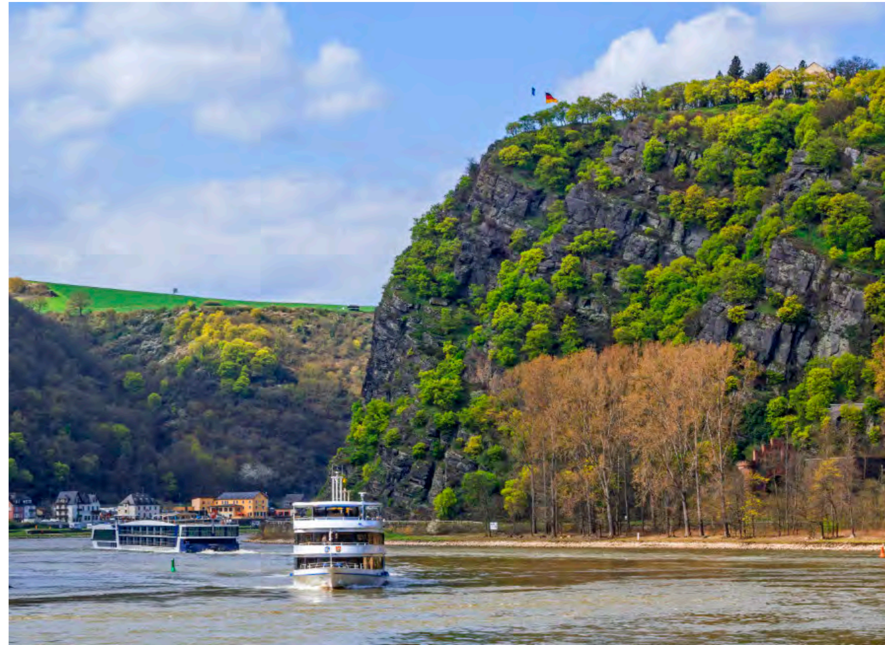
Rechts: Frisches Grün auf dunklem Schiefer – der Loreley-Felsen im Erwachen des Frühjahrs, während der Rheinverkehr unten seinen Lauf nimmt.