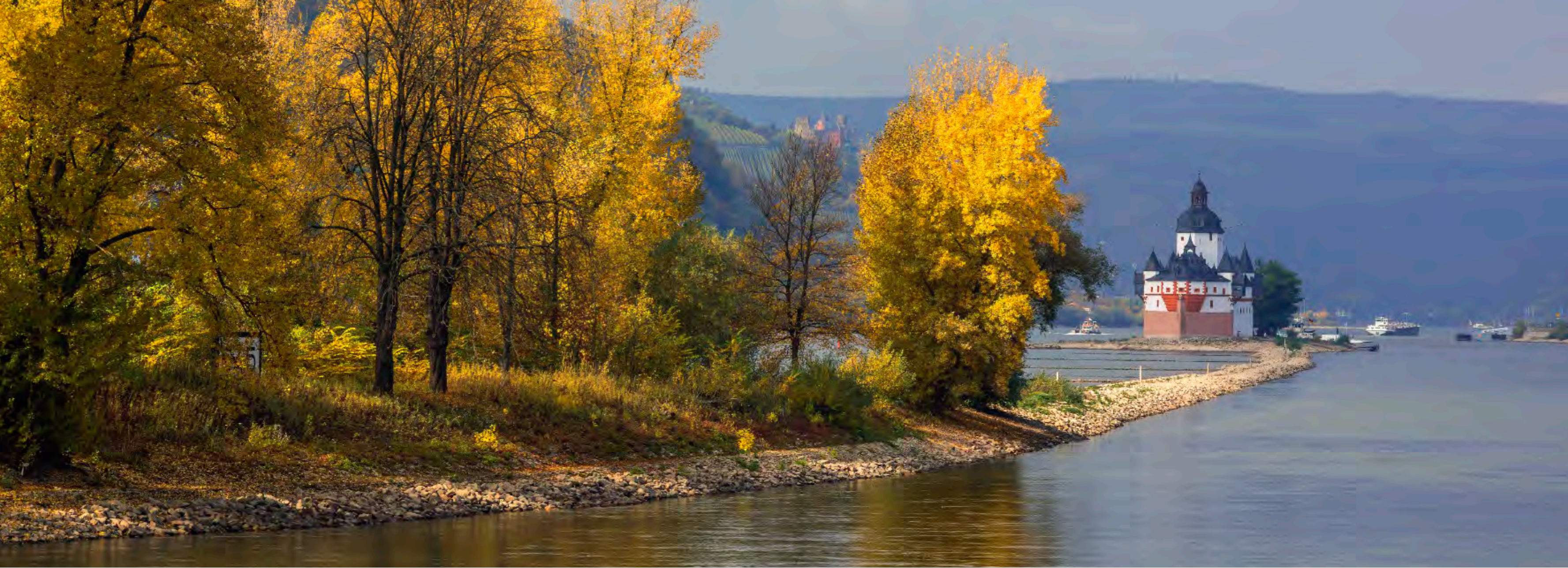
Herbstgold am Rheinufer bei Kaub: Die Pfalzgrafenstein taucht in der Ferne aus dem Strom auf, klein und dennoch unübersehbar voller Autorität.