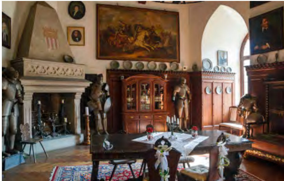
Rüstungen, Schlachtengemälde, Kerzenlicht – der Rittersaal von Burg Reichenstein nimmt seine Besucher mit in eine andere Zeit.