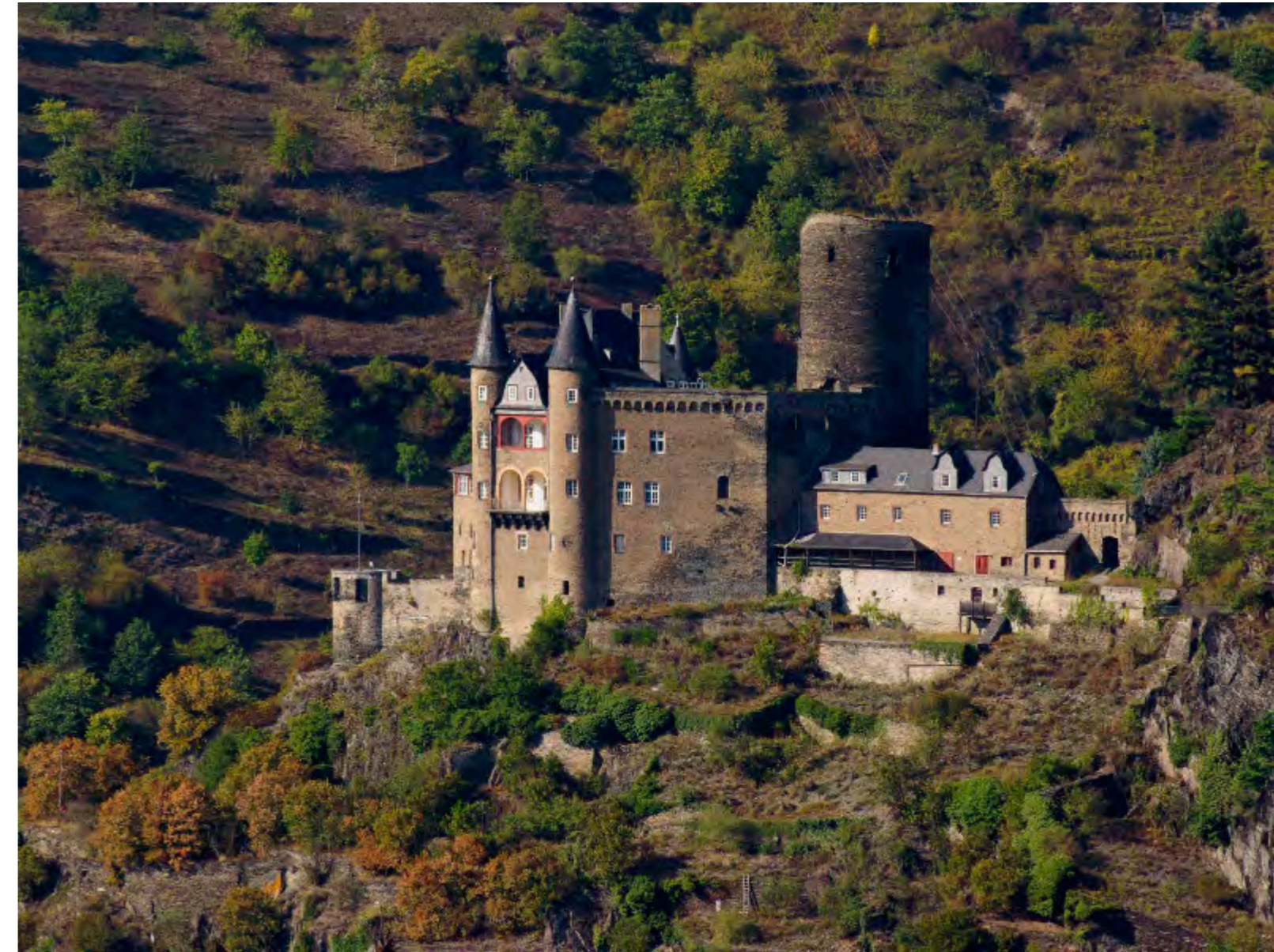
Burg Katz: aus jedem Blickwinkel überwältigend.