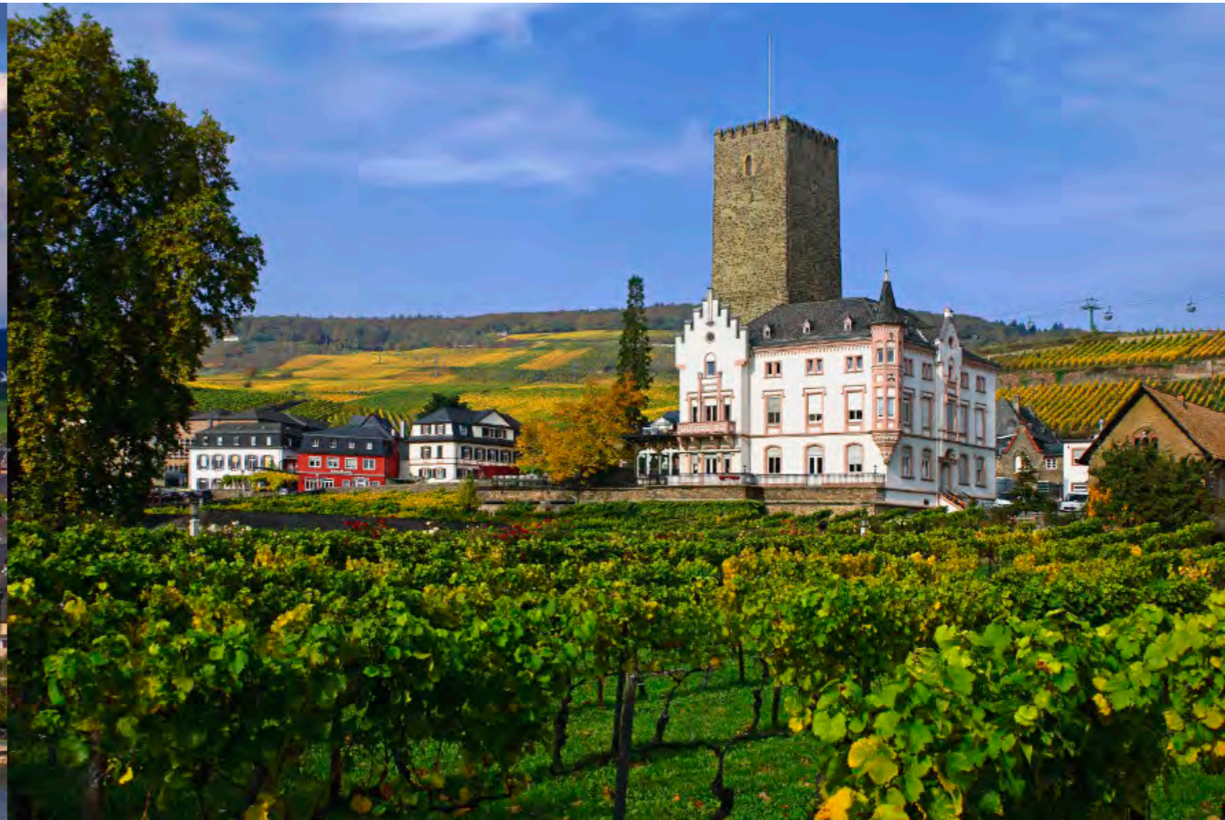
Zwischen Rebzeilen und weitem Himmel erhebt sich der alte Turm der Boosenburg – ein stiller Zeuge über den herbstlichen Weinbergen Rüdesheims.