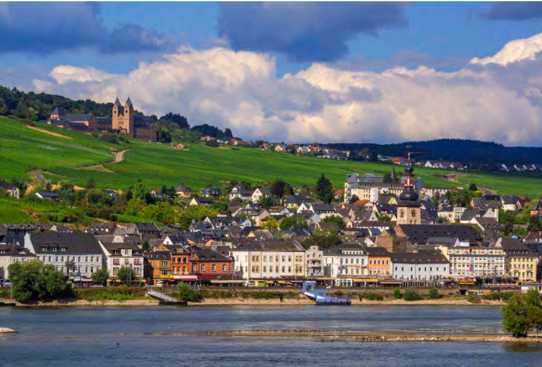
Vom Rhein aus führt der Blick hinauf: über die Dächer Rüdesheims, durch grüne Rebzeilen, bis zur Abtei St. Hildegard auf der Höhe.