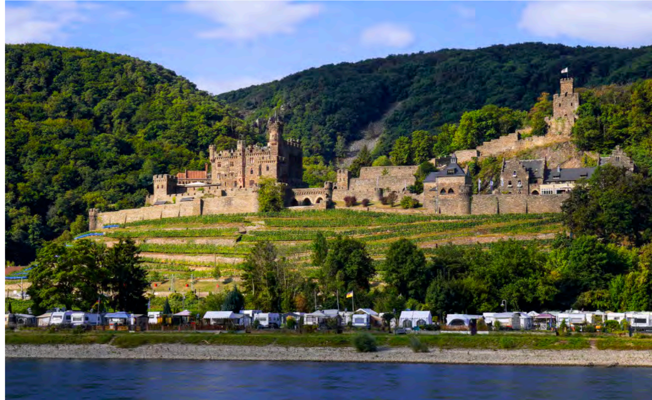
Rechts: Der Rhein spiegelt das Licht, dahinter staffeln sich Weinberg, Mauer und Bergfried – Reichenstein, wie es Generationen von Reisenden gesehen haben.