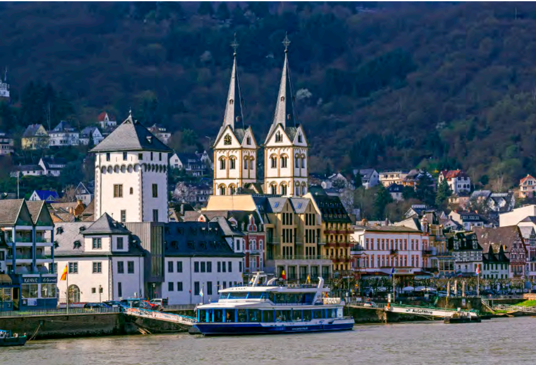
Kurfürstliche Burg und Basilika St. Severus prägen das Gesicht von Boppard – der Anleger am Ufer verbindet beide Rheinseiten.