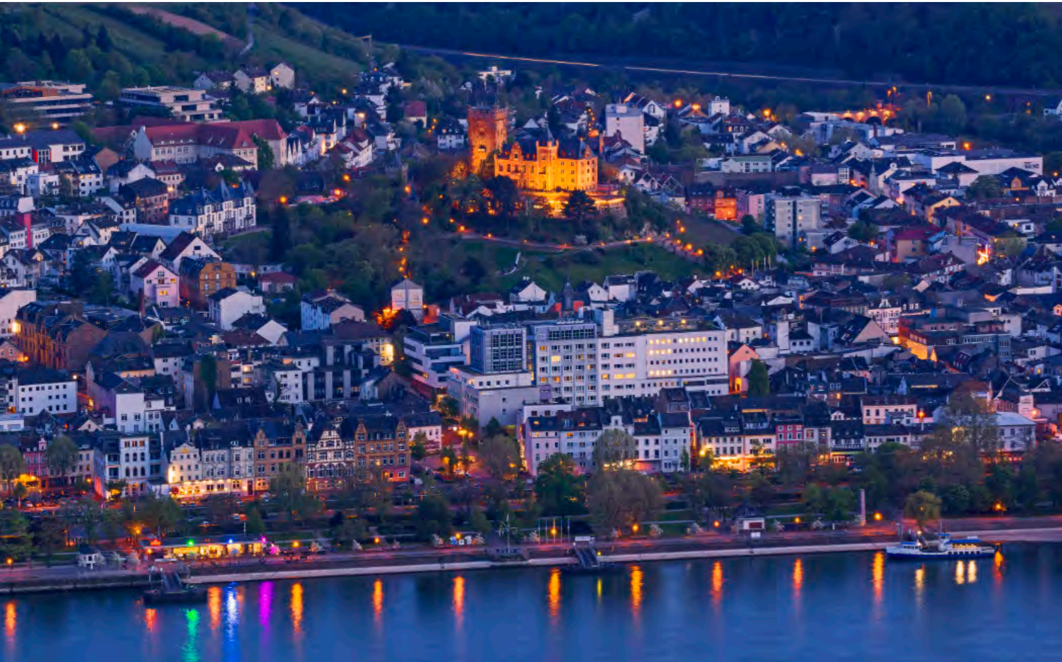
Links: Bingen am Abend: Burg Klopp leuchtet golden über der Stadt und dem Rhein.