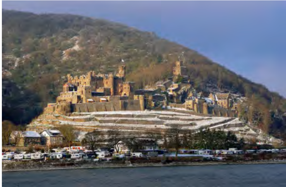
Im Winter zeigt Reichenstein seine ganze Ausdehnung – Buranlage, Mauern, Weinterrassen in einem Winterpanorama.