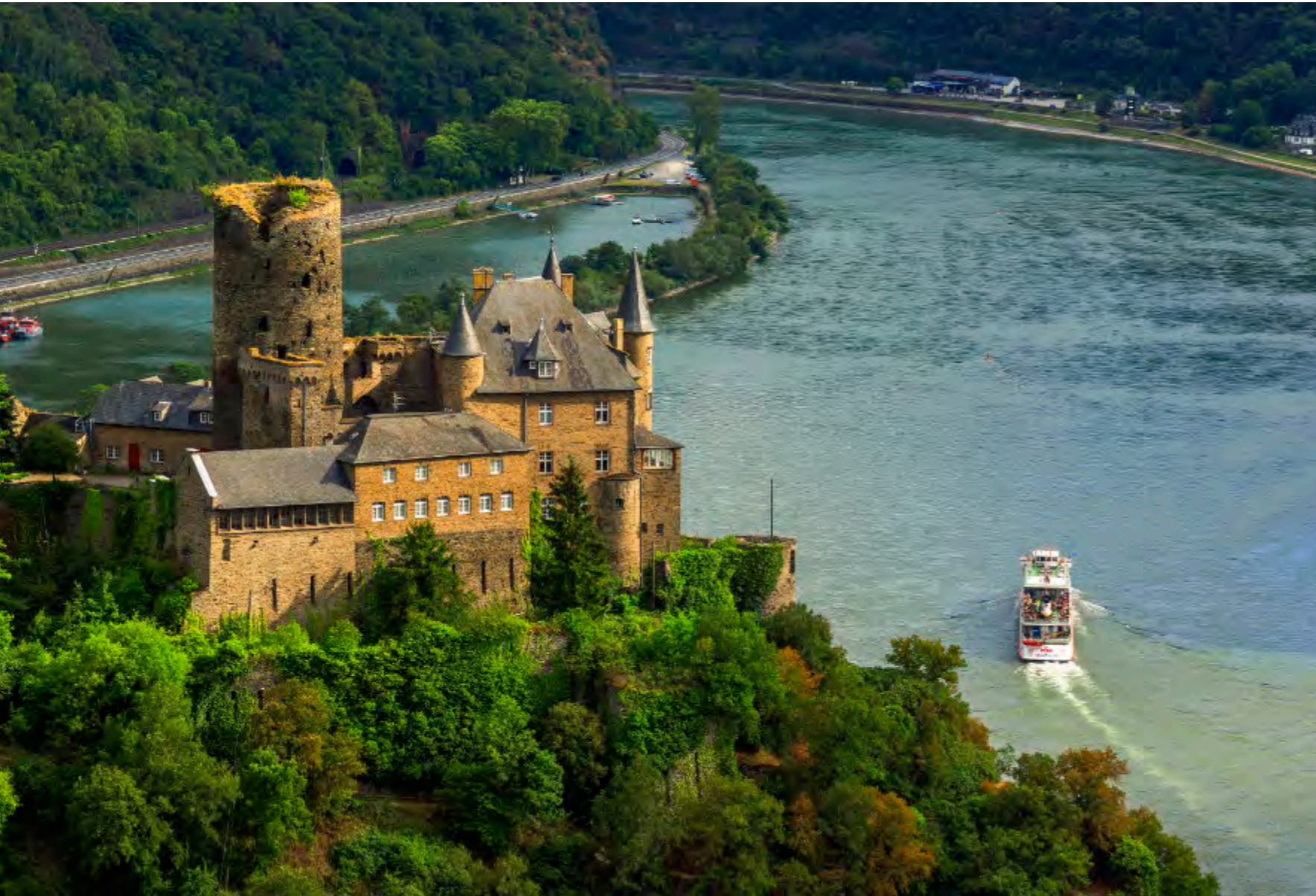
Von erhöhtem Standpunkt zeigt sich Burg Katz im Detail: Mittelalterlicher Bergfried und neogotischer Wohnbau von 1897–1905 thronen direkt über dem Rhein.