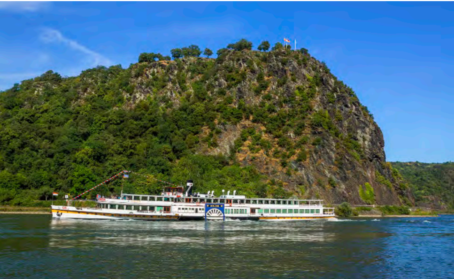
Das Schaufelradschiff »Goethe« passiert den Loreley-Felsen bei St. Goarshausen. 1913 gebaut, ist es heute das letzte Schaufelradschiff auf dem Rhein und ein schwimmendes Stück Rheingeschichte.