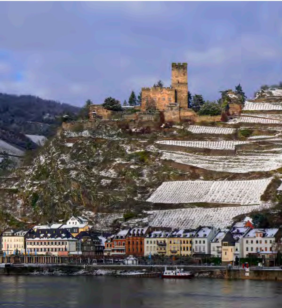
Schnee legt sich über Reben und Ringmauer: Kaub ruht, der Strom fließt.