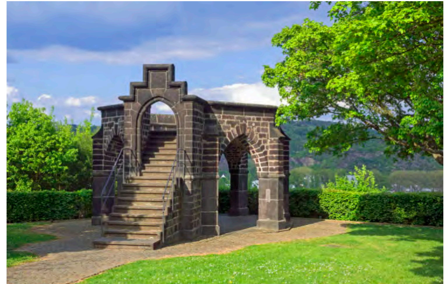
Stufen, die zur Geschichte führen: Auf dem Königsstuhl bei Rhens tagten die Kurfürsten des Heiligen Römischen Reiches.