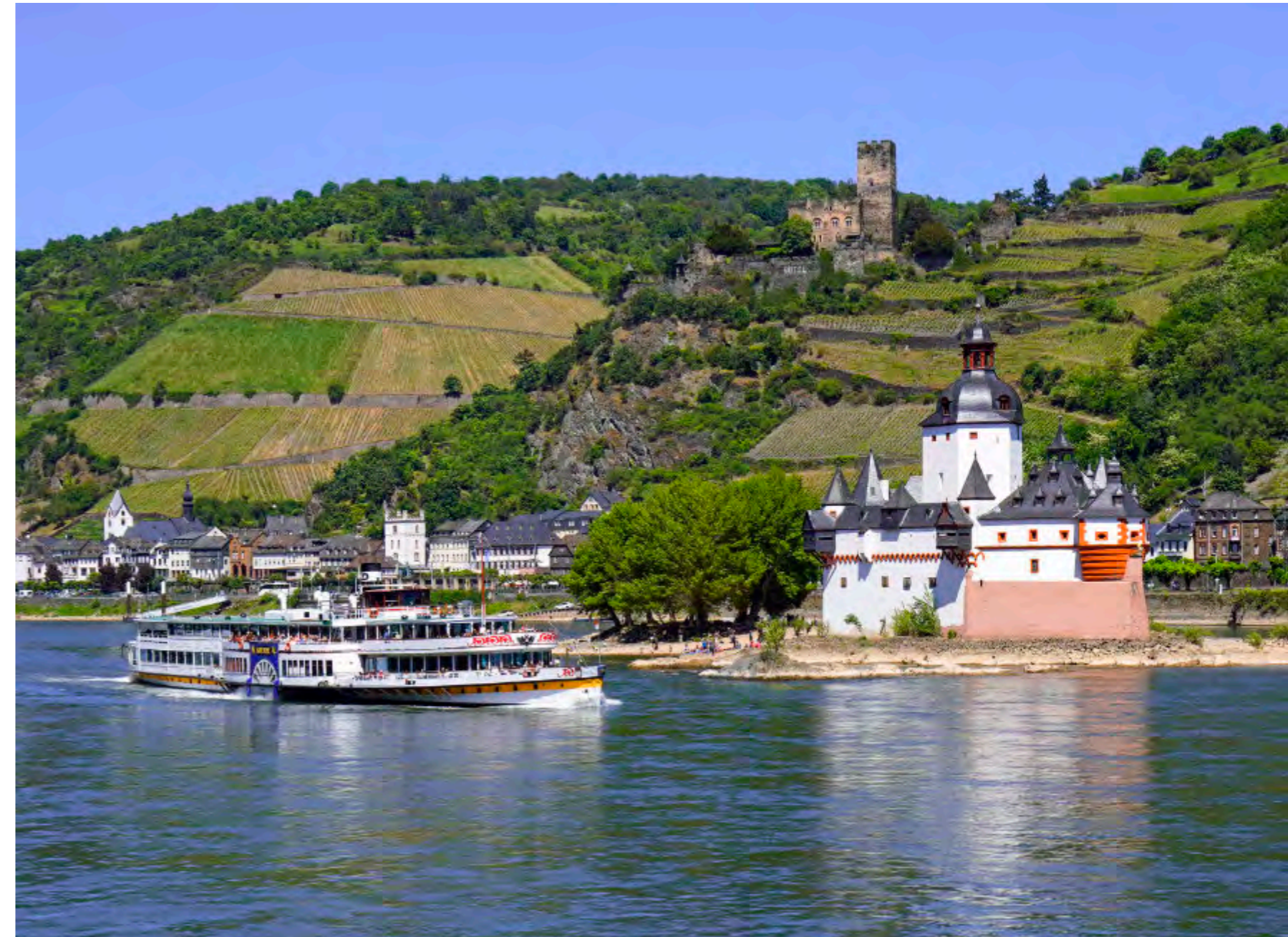
Rechts: Drei Welterbe-Ikonen in einem Blick: die Zollburg Pfalzgrafenstein auf ihrer Felseninsel, Kaub am Ufer und Burg Gutenfels auf dem Hang dahinter.