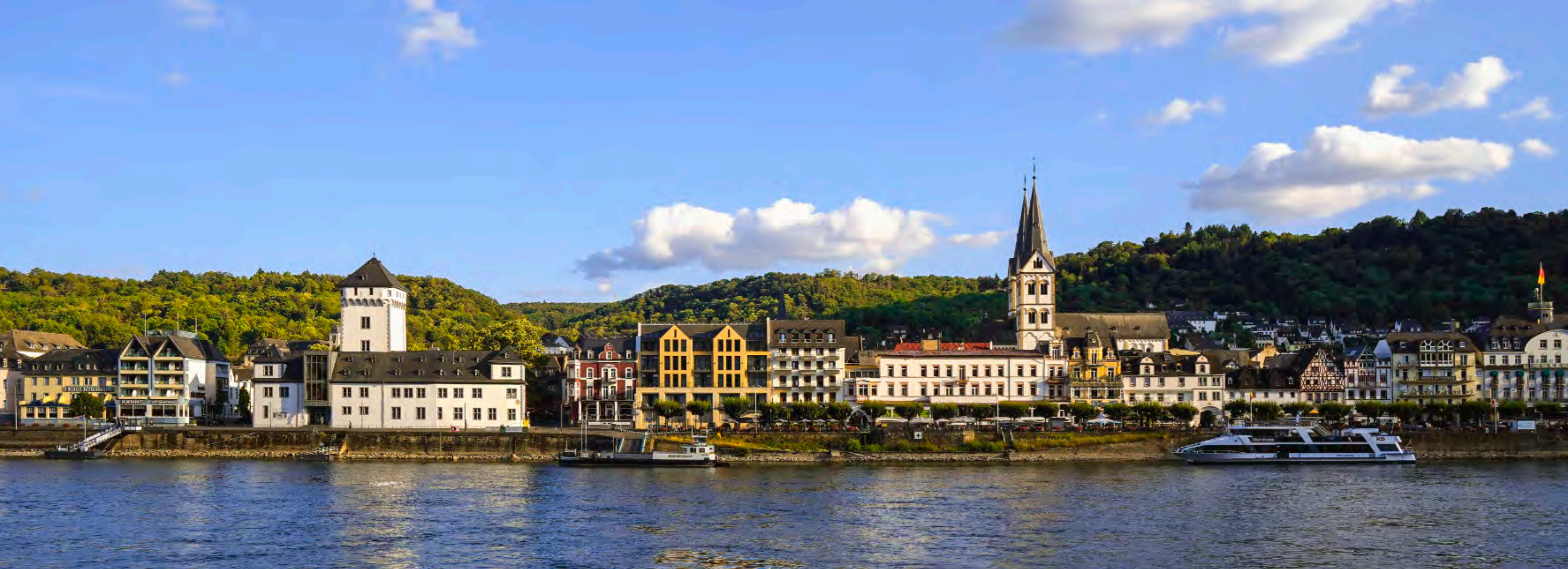
Sonnige Rheinfront in Boppard: Kurfürstliche Burg und St. Severus setzen markante Akzente über der belebten Uferpromenade.