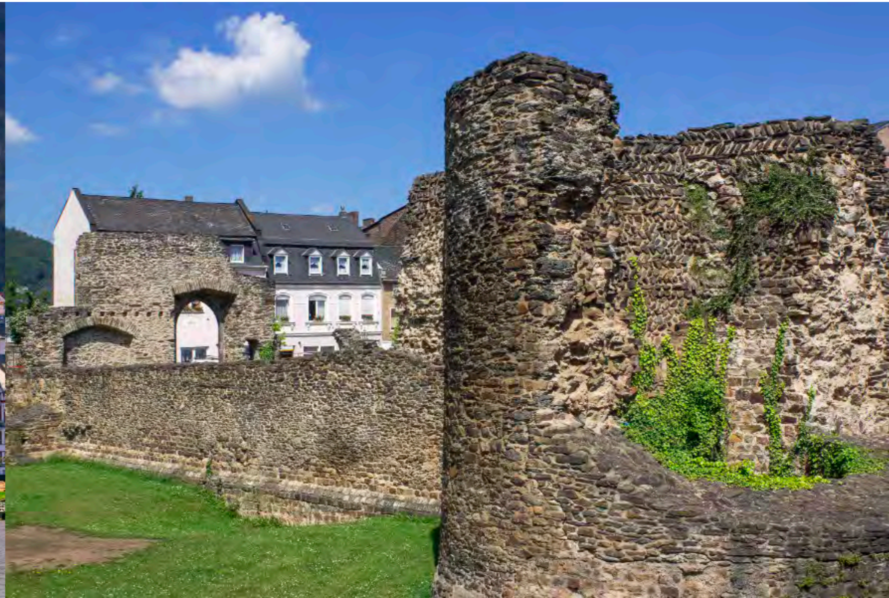
Rund 1700 Jahre altes Mauerwerk mitten in der Stadt: Das römische Kastell Bodobrica in Boppard zählt zu den besterhaltenen Römeranlagen am Rhein.