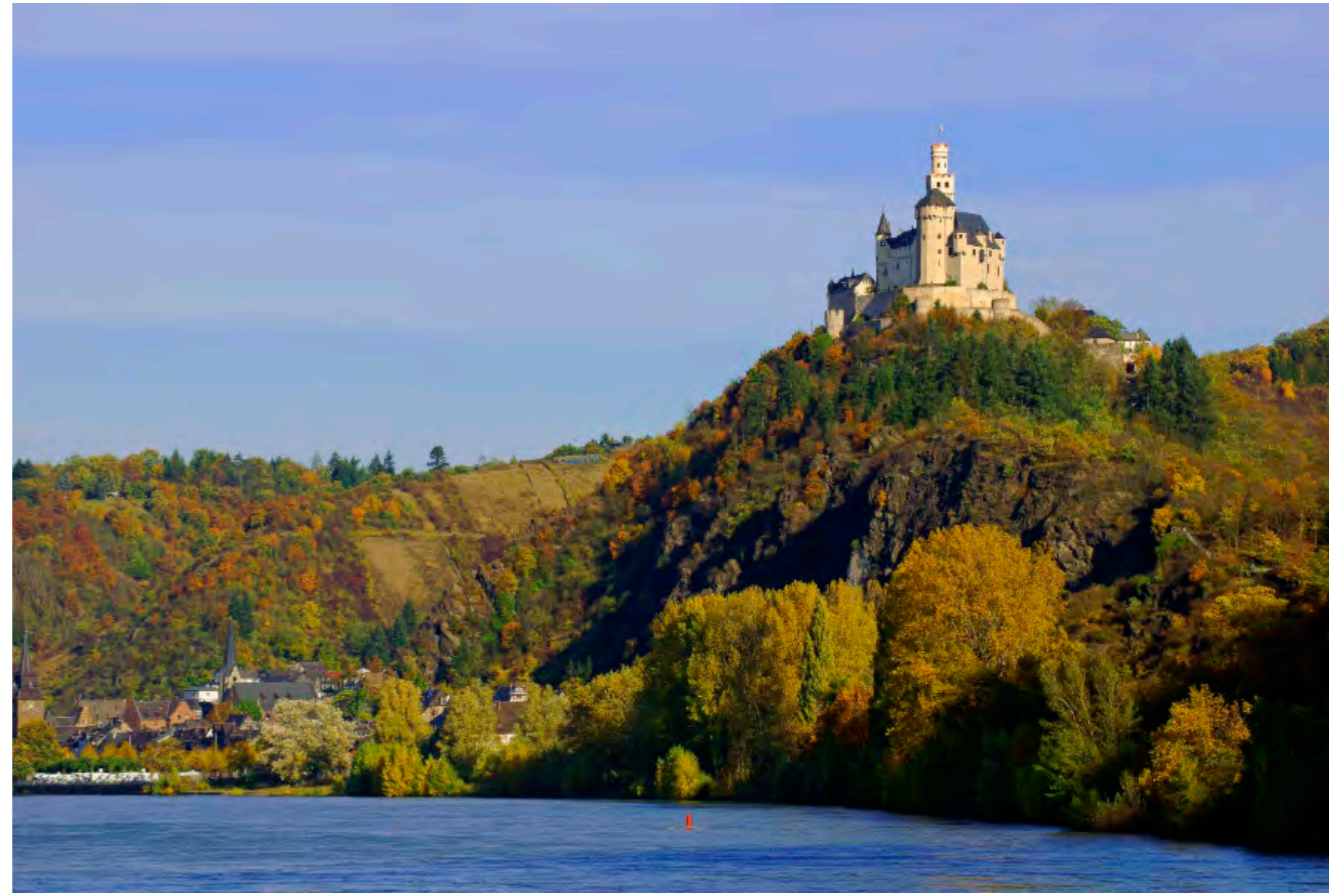
Der Fels trägt die Burg, der Herbst trägt die Farbe – am Rhein bei Braubach ordnet sich alles von selbst.