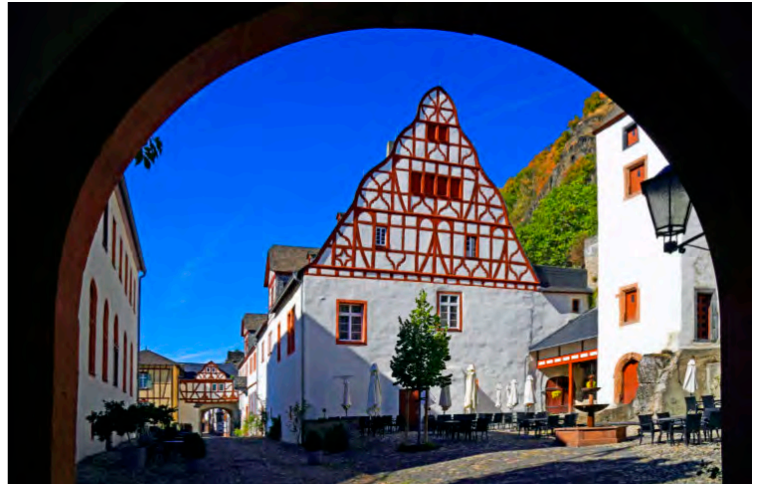
Der Innenhof von Schloss Philippsburg in Braubach – der Zierfachwerk-Treppengiebel des Hauptgebäudes ist das Wahrzeichen der Anlage.

Links: Ein Torbogen, eine Gasse, Sommerlicht auf altem Pflaster – Braubach zeigt sein mittelalterliches Gesicht.